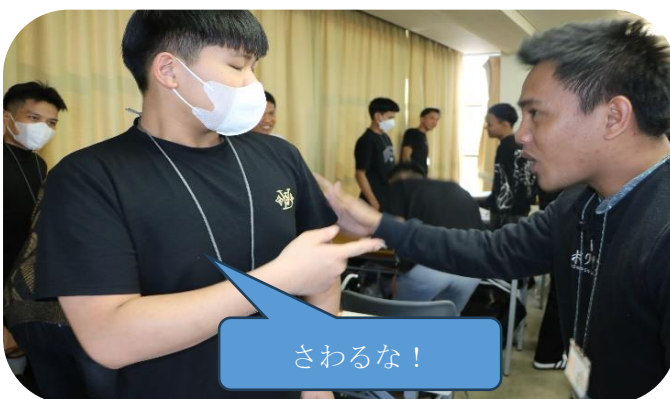
写真3：命令形、禁止形の練習