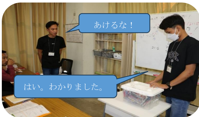
写真1：いろいろな動詞を使って練習しました

緊急時には、その日本語がわからないと命を落としてしまうこともあります。3年間しっかりと最後まで実習をやり通すには、「安全に業務をすること」が最低条件です。この最低条件をかなえるためにも、こういった日本語もしっかりと身に付けていってほしいと思っています。