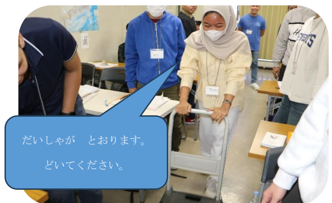
写真2：台車を押して通る練習