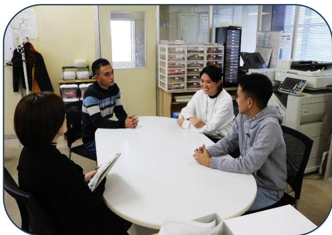
グループ会話だと、リラックスできるのか、笑顔も見られます

今月のあじけんスコープは、今後取り入れる予定の「新会話テスト」についてお知らせします。