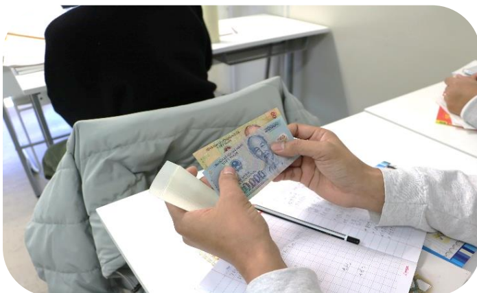
写真3：お年玉の袋を開けてびっくり！