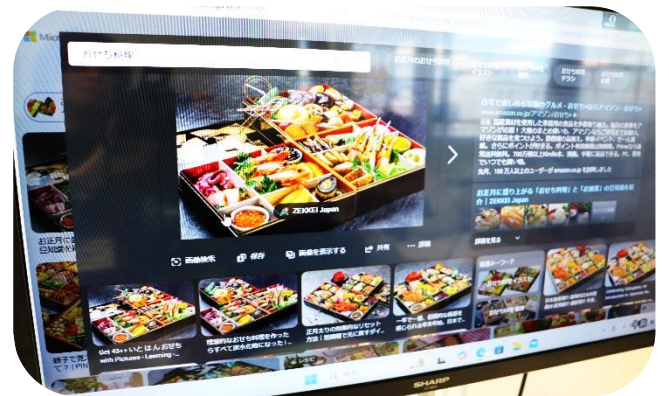
写真2：おせち料理も映像で確認しました