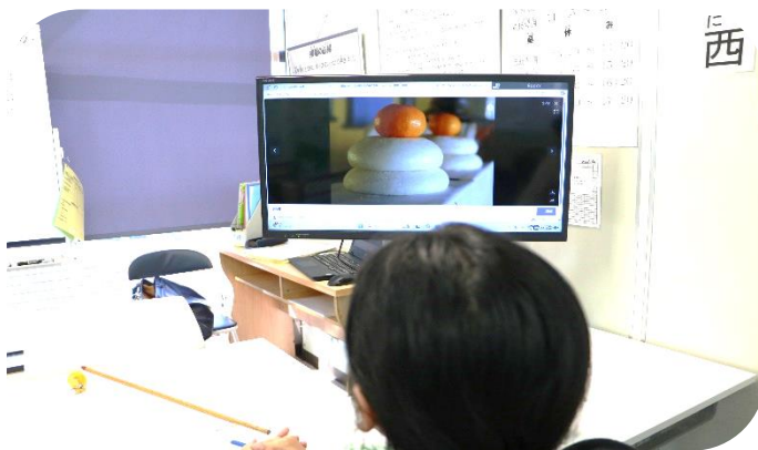
写真1：鏡餅を見てびっくりしていました

2025年もその実習生にあった必要な、有意義な日本語が指導できるよう、講師一同、日本語指導に励みたいと思います。本年もどうぞよろしくお願いいたします。