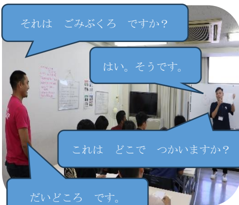
写真4: 絵が上手だと、すぐわかります