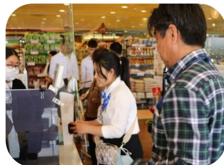
指導員が見守る中、支払に挑戦する実習生