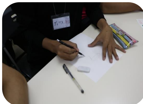
写真2: カードに書いてある名詞の絵を描きます