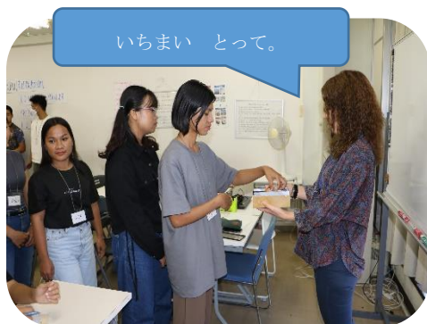
写真1: 名詞が書いてあるカードを取ります

この活動自体はシンプルですが、実習生自身が疑問詞など、様々な語彙を使って、たくさんの質問をすることができます。実習生は言葉自体を「暗記」することは得意ですが、その名詞に関する質問文などを理解すること、やりとりを通してその言葉の意味を導き出すことなどは苦手です。ですので、この活動は、疑問詞などを使って、わからない言葉についてやりとりをして解決するという練習ができます。またそれによって印象的に言葉を覚えることができます。実習生の描く絵が全く何を書いているかわからなかったり、絵を描いた実習生が言葉を勘違いしたりすると、質問も多くなり、クラスが一気に盛り上がります。言葉を覚えることは単純でつまらないこともありますが、当校ではできるだけ楽しく言葉が覚えられるよう工夫して授業を行っています。これからも楽しく日本語が習得できるようアイデアを出し合っていきたいと思います。