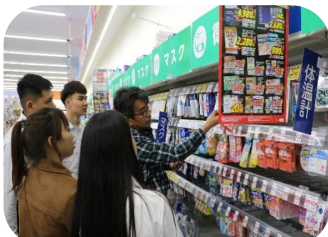
薬局で商品の説明に関き入る実習生達