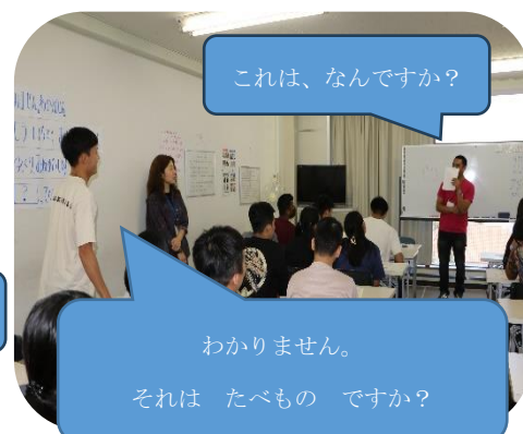
写真5: わからないときは、ヒントをもらいます