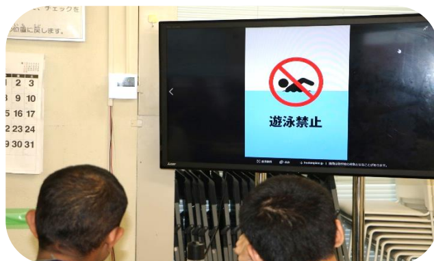
写真4：禁止事項の説明を聞きます

※ 当校ホームページ http://www.ajiken.jp/ から「あじけん通信」バックナンバーもご覧になれます。