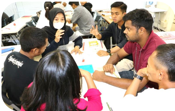
写真1：いろいろな国の実習生が真剣に話しています

日本人のみならず地域に住む外国人（実習生も含む）が夏に水の事故や、災害に巻き込まれることも少なくありません。また、特に実習生は公共のルールがわからないことも多いかと思えます。実習先での事故やトラブルを避けるためにも、当校でのこういった学習が役に立てばと考えております。今後も実習生の実習先での安心、安全につながる内容について、授業の中で積極的に取り組んでいく予定です。