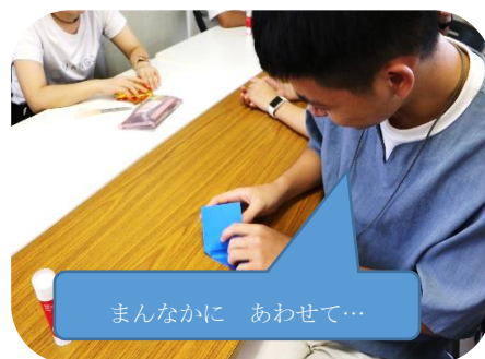
写真4：色紙の色を日本語で言えともらえます