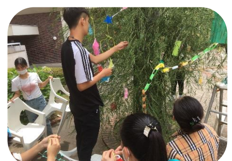
写真6：みんなで飾りました