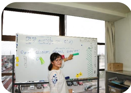
写真1：七夕飾りを説明します

後日、出来上がった飾りを、自分たちで竹に付け(写真⑥)、七夕の笹を彩りました。素敵な飾りが七夕の笹を豪華にしてくれました。文化体験を通して、実習先でも役に立つ、実践的な日本語力がつけられよう、日本語指導を工夫していきたいと考えております。