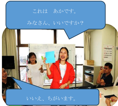
写真3：講師から予期せぬ質問が…